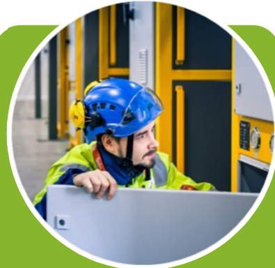
Energia- ja lämmitysratkaisut