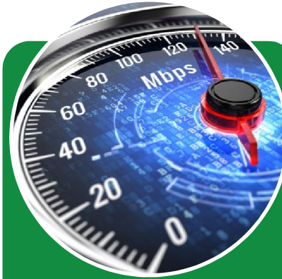
Netti ja tv-palvelut